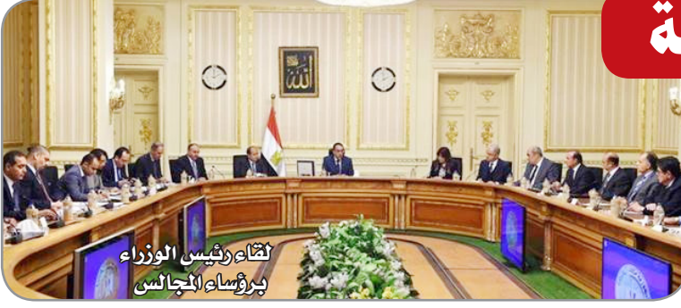
لقاء رئيس الوزراء برؤساء المجالس

عقد الدكتور مصطفى مدبولي رئيس مجلس الوزراء لقاء موسعا مع رؤساء المجالس التصديرية بشأن برنامج جديد لتحفيز الصادرات والذي يتم إعداده حاليا بوزارة الصناعة ليحل محل البرنامج الحالي لدعم الصادرات.