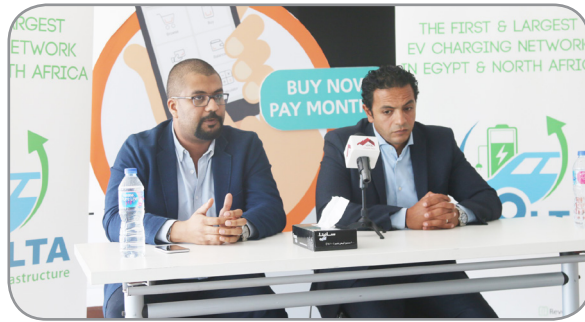
( صورة لتوقيع شراكة ريفولتا وفاليو )

في توفير التمويل المرن وبرامج الدفع بالتقسيط للمستهلك المصري، حيث تعطي أول 100 عميل يقومون بالتقسيط من خلال فاليو فرصة الشحن المجاني لسياراتهم الكهربائية حتى نهاية عام 2019.